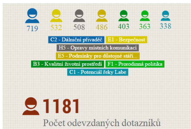
OBRÁZEK 2: VÝSLEDKY ŠETŘENÍ DLE HLASOVÁNÍ OBČANŮ MĚSTA – PŘEHLED NEJVÍCE BODOVANÝCH ROZVOJOVÝCH CÍLŮ

Pozn: Názvy rozvojových cílů(dříve priorit) byly z technických důvodů zkráceny.