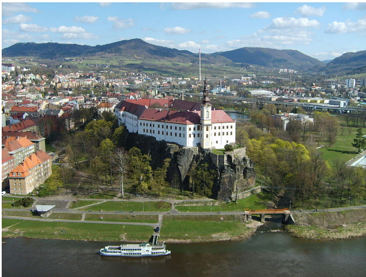
Autor: Ondřej Koniček, Název: Pohled na děčínský zámek z Pastýřské stěny.