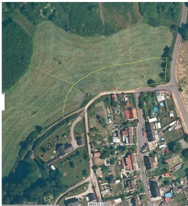
Obrázek č. 1 – původní parcelace s vymezením kompromisní výměry návrhové plochy Z11 v k. ú. Ovesná.