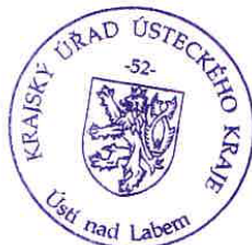
RNDr. Tomáš Burian v zastoupení vedoucí odboru životního prostředí a zemědělství

Toto stanovisko SEA není závazným stanoviskem ani rozhodnutím podle zákona č. 500/2004 Sb., správní řád, ve znění pozdějších předpisů a nelze se proti němu odvolat.