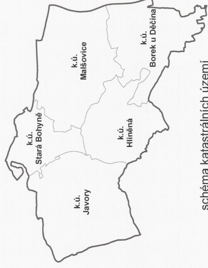
schéma katastrálních území