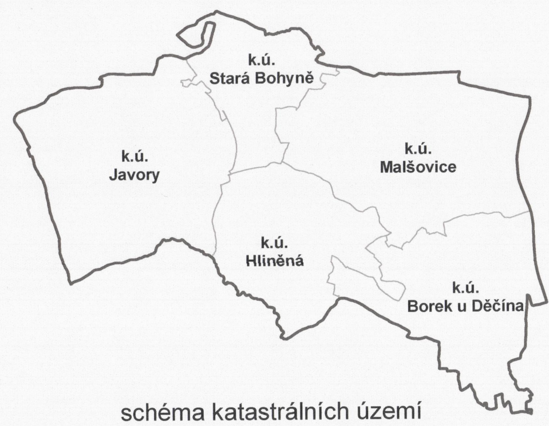
schéma katastrálních území