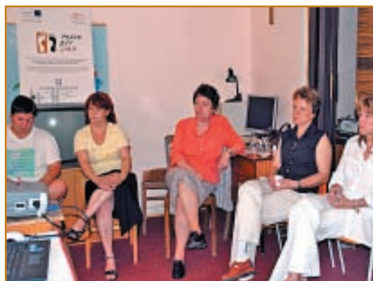
Workshopy k projektu probíhaly v červnu 2007 za účasti pracovníků státní správy i místní samosprávy. Výstupem workshopů je mimo jiné tato publikace.