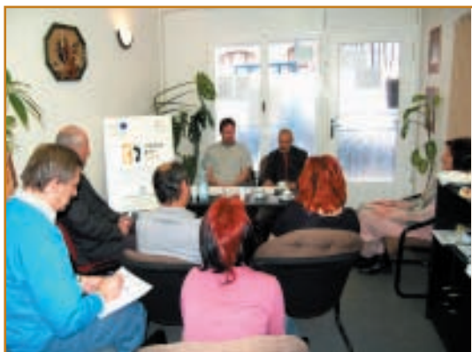
Úvodní tisková konference k projektu „Právo být jiný“ se konala 28. 2. 2007.