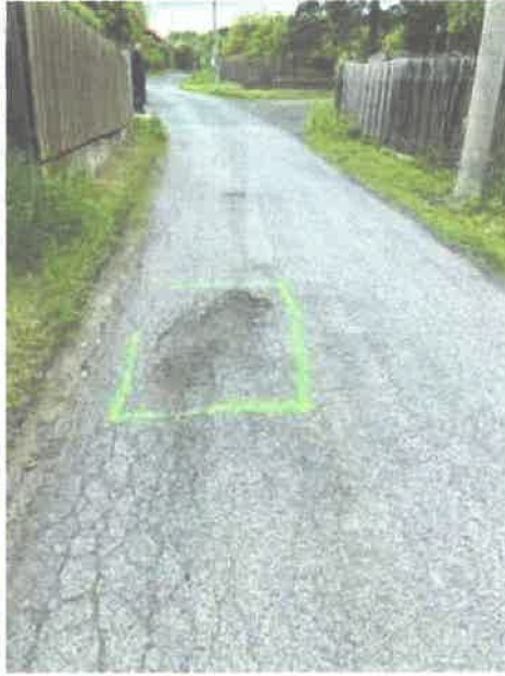
50.76267N ; 14.15163E