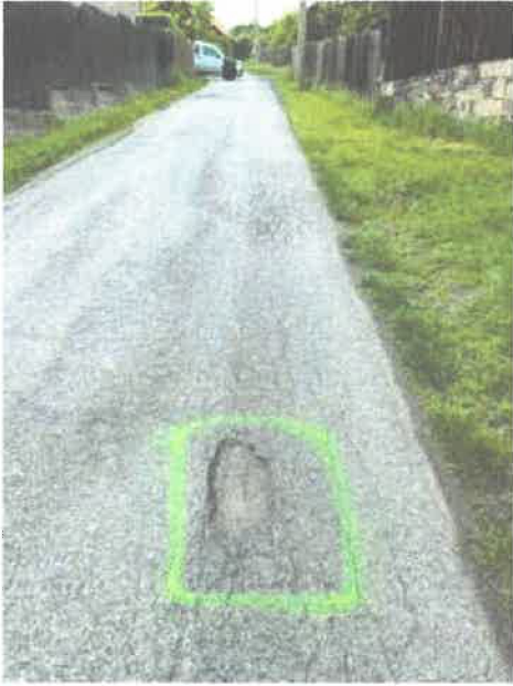
50.76264N ; 14.15185