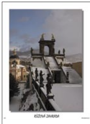
2. místo název: Růžová zahrada autor: Jiří Řehák