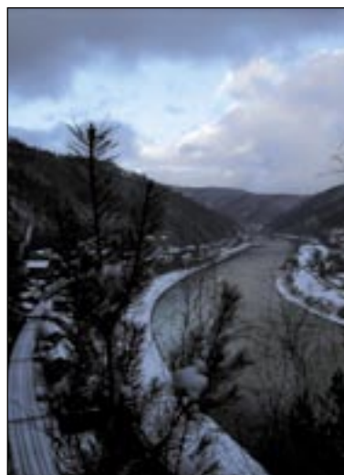
3. místo název: Pohled na Loubí autor: Jan Čabák