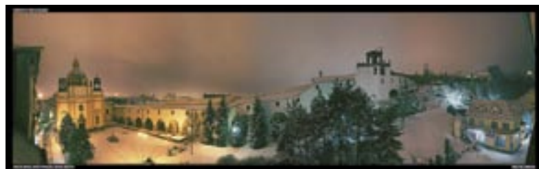
5. místo název: Where is the Solaris autor: Michal Řehák