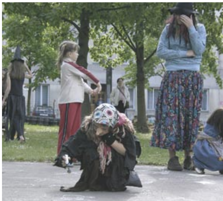
Ze soutěží bylo nejpoblárnější malování křídami.