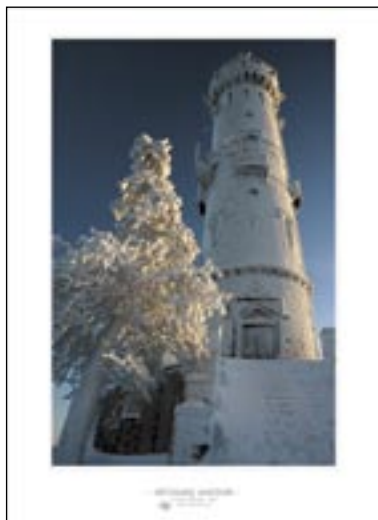
1. místo název: Děčínský Sněžník

borná porota. Podle jejího verdiktu je vítězným snímkem ten, který u návštěvníků internetových stránek skončil pátý. (mm, pwt)