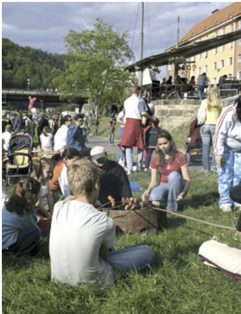
Vedle velké vatry hořely na nábřeží i malé ohýnky, kde si mohli lidé opéct vlastního buřta.