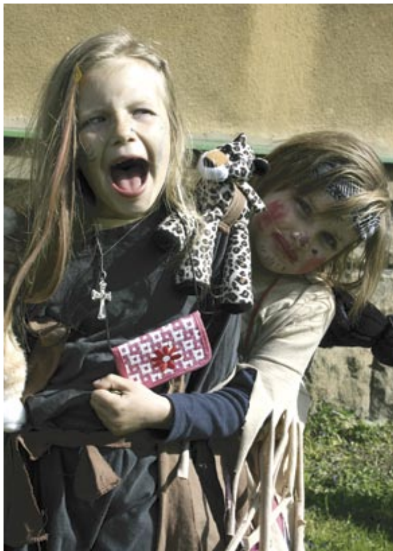
Dvě čarodějnice v Březinách pózuji pro čtenáře zpravodaje.