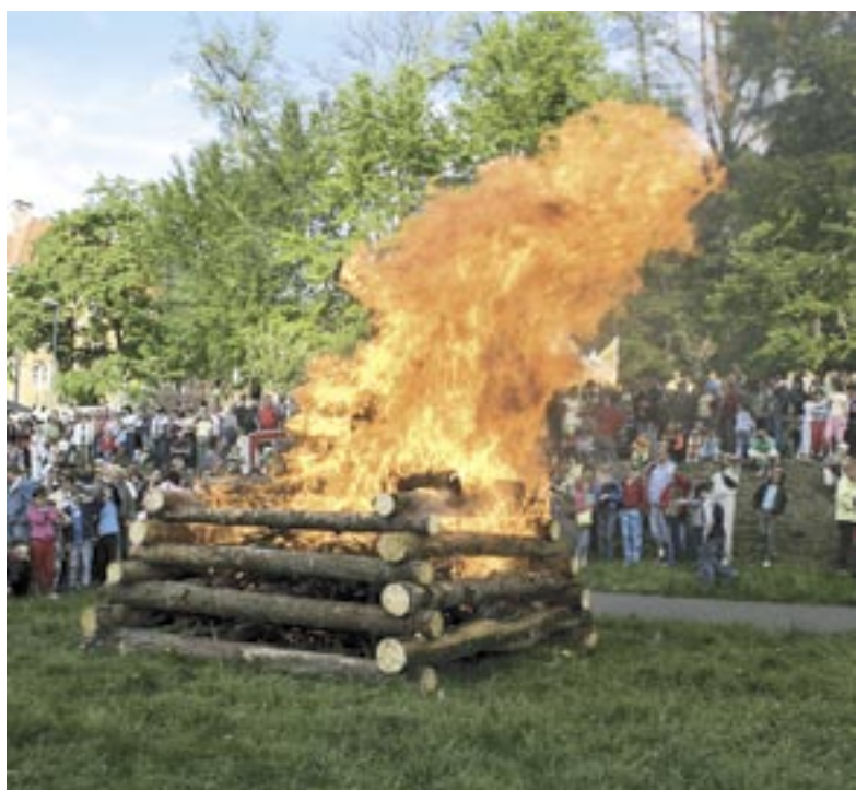
Vatra, která i s čarodějnicí na vrcholu měřila 3 metry, hořela několik desítek minut.