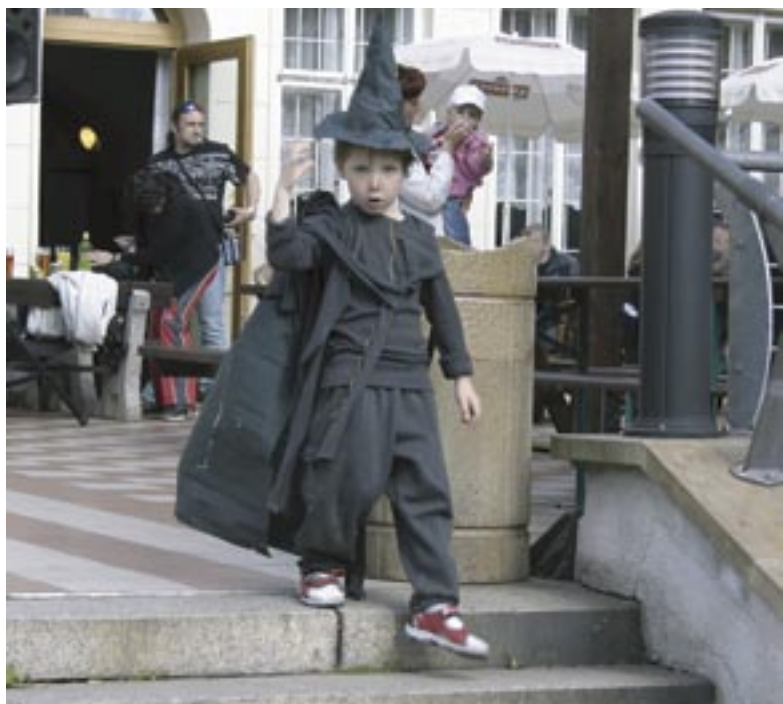
Na oslavu pálení čarodějnic přišla většina dětí v převlecích.