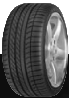
TYRE: Eagle F1 Asymmetric

Pneumatiky Goodyear žádejte v síti profesionálních auto-pneu servisů