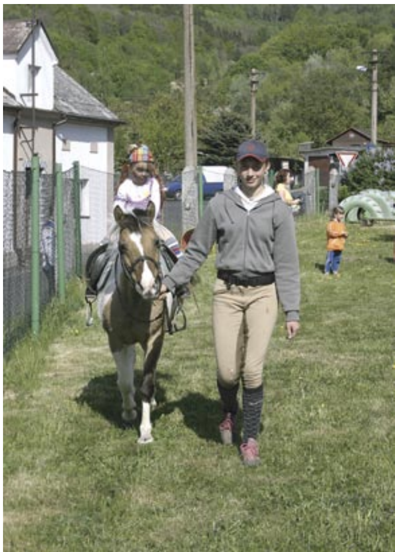
V DDM Březiny jezdily čarodějnice na koních.