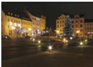
4. místo název: Děčín před vánoci autor: Bohumil Kozák