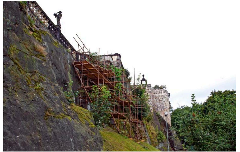
Lešení ve svahu pod Růžovou zahradou.

Údržba tak rozsáhlého objektu přináší je samozřejmě velmi náročná, a je třeba při ní respektovat specifické požadavky památkového objektu. V opačném případě hrozí, že vynaložené finanční prostředky přijdou vniveč. Některé opravy provedené v 90. letech bohužel byly značně nešťastné a již jednou zrenovované části tak vyžadují další zásah. Nejkrákladějším příkladem je zámecká střecha, která prochází v současné době výměnou. Podobným případem je