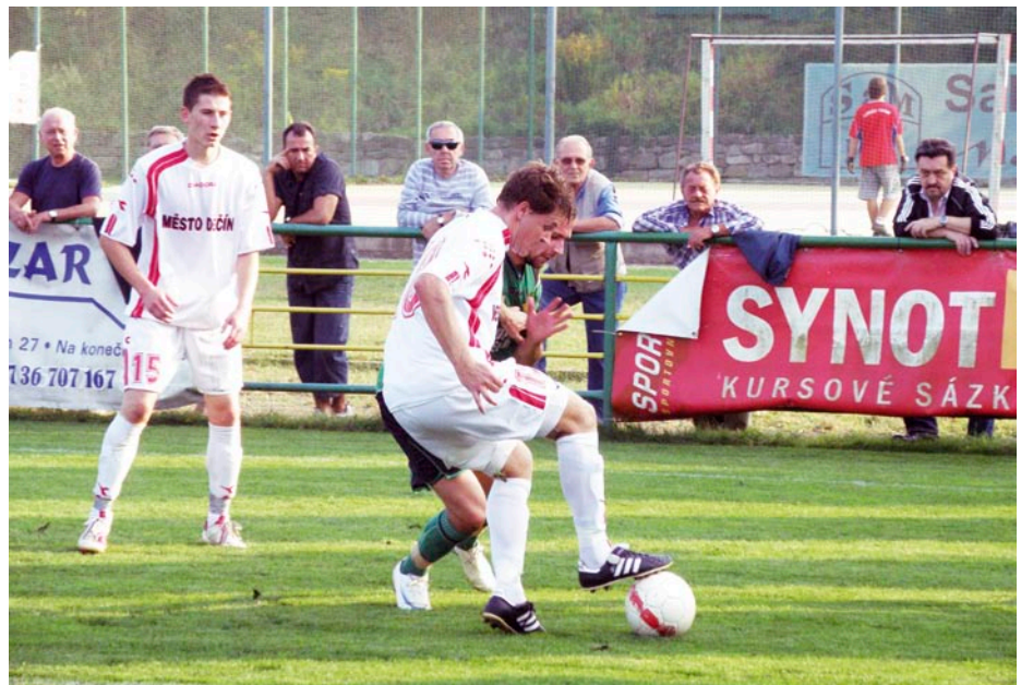
Řezníci nenašli přemožitele ani v třetím divizním utkání v řadě. Tentokrát remizovali s rezervou druholigového Sokolova na domácím hřišti 1:1.