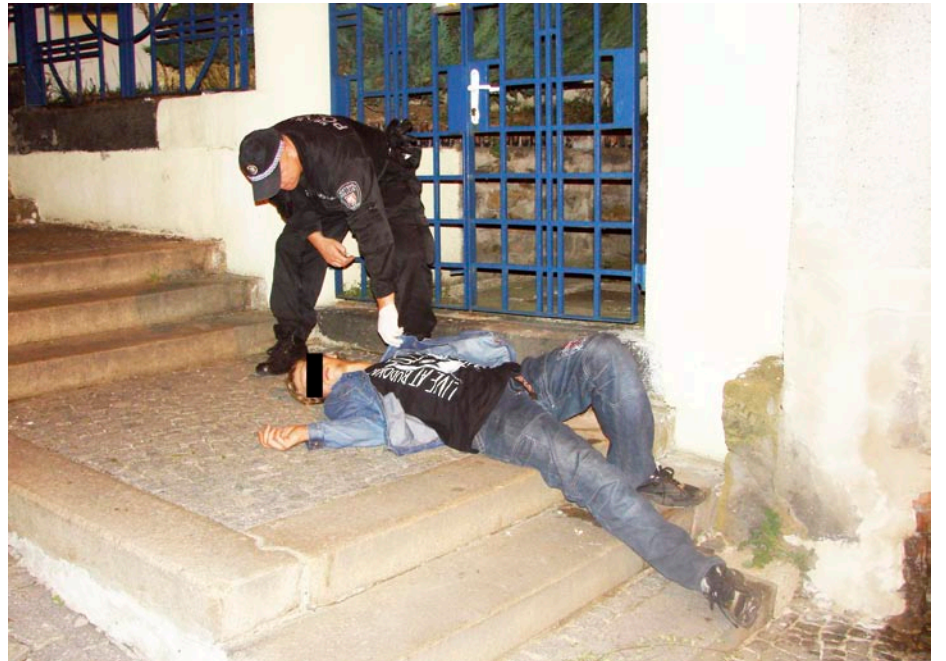
S opilci se často potýkají strážníci děčínské městské policie. Pod vlivem alkoholu usnul mladík na fotografii na schodech na Pastýřskou stěnu. Mladého muže strážníci po ztotožnění, zjištění, zda není zraněn a následně důrazně domluvě nasměrovali do místa bydliště.