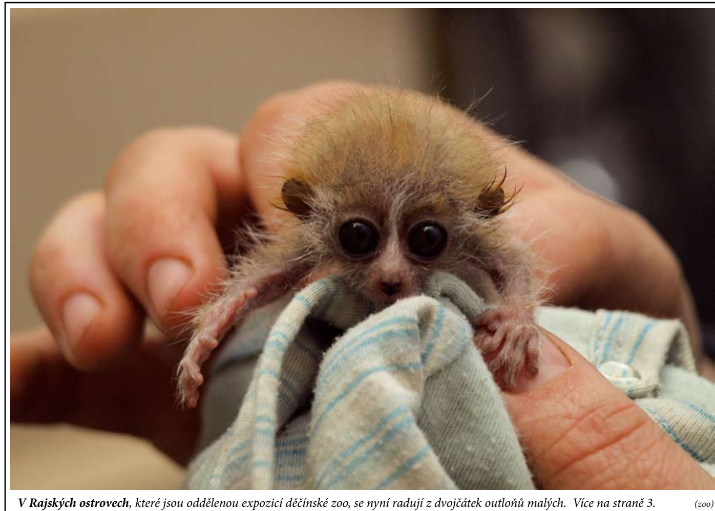
V Rajských ostrovech, které jsou oddělenou expozicí děčínské zoo, se nyní radují z dvojčátek outloňů malých. Více na straně 3. (zoo)

bytovou záležitost, ale intenzivní výchovnou činnost zaměřenou na děti z rizikového prostředí, což by se mělo vrátit v podobě pozitivních dopadů na společnost. Na tyto projekty město získalo celkem sto osmdesát sedm tisíc korun,“ dodal primátor. (tp)