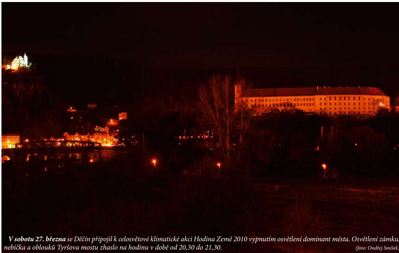
V sobotu 27. března se Děčín připojil k celosvětové klimatické akci Hodina Země 2010 vypnutím osvětlení dominant města. Osvětlení zámku, nebička a oblouků Tyršova mostu zhaslo na hodinu v době od 20,30 do 21,30.

Děčín - Město se symbolicky připojilo k celosvětové klimatické akci Hodina Země 2010. Podobně jako mnoho dalších měst na hodinu vypnul osvětlení dominant města.