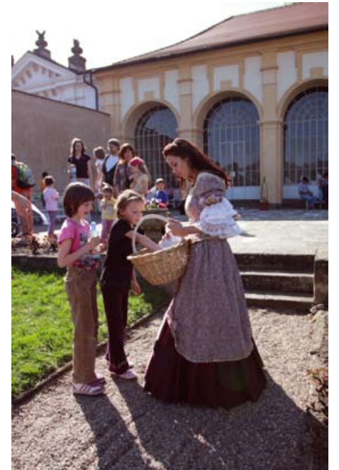
Na velikonoční pondělí mohou děti s princeznou hledat ztracená vajíčka. (foto: Zámek Děčín)

Hlavní zámeckou událostí druhé poloviny měsíce dubna bude znovuvyvěcení zámecké kaple sv. Jiří. Bližší informace se dozvíte v příštím čísle zpravodaje. (zámek)