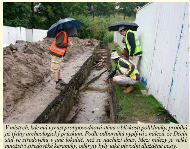
V místech, kde má vyrůst protipovodňová stěna v blízkosti polikliniky, probíhá již týdny archeologický průzkum. Podle odborníků vyplývá z nálezů, že Děčín stál ve středověku v jiné lokalitě, než se nachází dnes. Mezi nálezy je velké množství středověké keramiky, odkryty byly také původní dlážděné cesty.