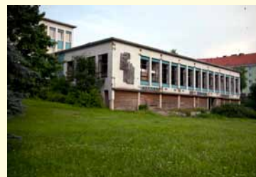
Budova bývalého spol. domu Atlantik.

Na místě bývalého společenského domu Atlantik vyrostla nová budova městské knihovny. Původní budova byla částečně zdemolována v srpnu 2009. Pro čtenáře se knihovna otevře v září. Projekt byl realizován za podpory Evropské unie.