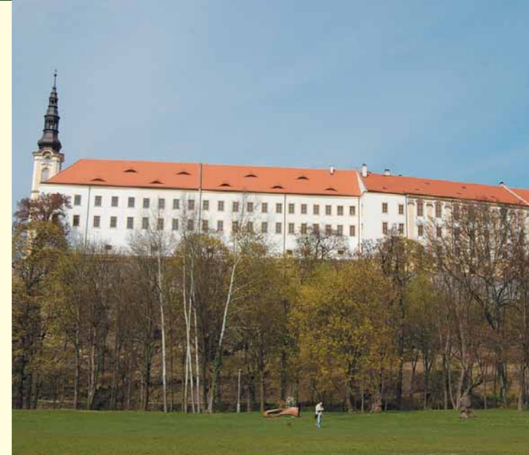
Jižní křídlo děčinského zámku bylo rekonstruováno díky dotaci z ROP Severozápad.