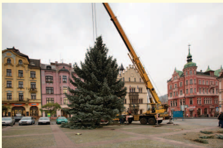
Strom od soukromého dárců zdobí Masarykovo náměstí. Velký vánoční strom z Folklnářů se poprvé rozsvítí o první adventní neděli 2. 12. v 17 hodin. Po celý víkend budou na Masarykově náměstí trhy doprovázené zajímavým programem. Hlavní hvězdou nedělního programu budou Poutníci, kteří vystoupí v 16 hodin.

patřit pouze DDM Teplická a Základní škole Máchovo náměstí. Školy a DDM si kromě programu s mažoretkami a vánočními koledami připravily také prezentace svých výrobků. (romi)