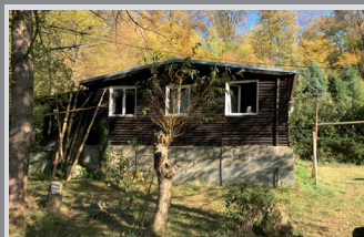
6691 Rekreační chata Studený

Chata v krásné přírodě, pozemek (952 m 2 ) se stav. povolením, Studený: 880 000 Kč