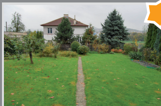
6688 Stavební pozemek Staré Město

Pěkná zahrádka (348 m 2 ) s novou pergolou a dřev. boudou, Václavov, Děčín: 140 000 Kč