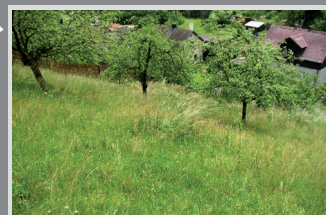
6044 Stavební pozemek Bělá

Pozemek (468 m 2 ) mimo záplavovou oblast, U Přívozu, St. Město, Děčín: 500 000 Kč