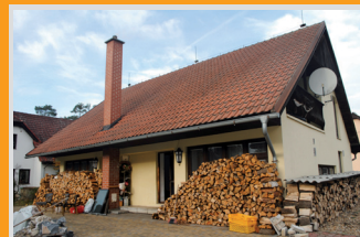
6698 Rod. dům u Máchova jezera

Roubený dům s garáží a zahradou, blízko centra, Červený vrch, Děčín: 2 500 000 Kč