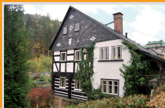
6690 Roubený dům Červený vrch

Roubený dům s garáží a zahradou, blízko centra, Červený vrch, Děčín: 2 500 000 Kč