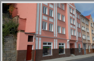
6670 Prodejna Labské nábřeží

Slunný pozemek (1315 m 2 ) s povolením, Sněžnická ul., Bělá, Děčín: 600 000 Kč