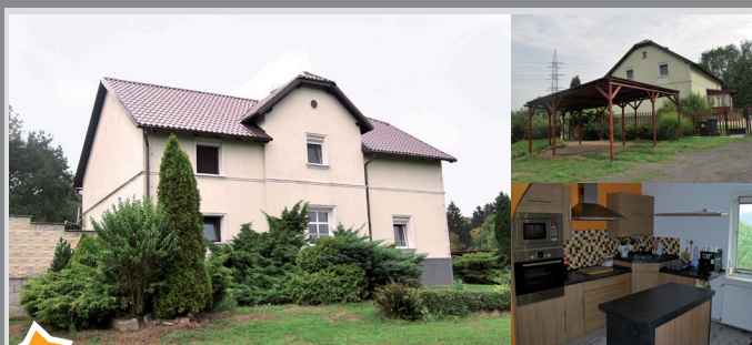
6673 Krásný rodinný dům Chrochvice

Rodinný dům s velkým pozemkem (4 334 m 2 ) se nachází na krásném místě pod vrcholem kopce Chmelák. Objekt prošel rozsáhlou rekonstrukcí, nová střecha, okna, rozvody vody, topení a elektřiny. Příslušenství domu tvoří velká zahrada doplněnou stavbou kolny/garáže a zastřešené parkovací stání. Dům lze snadno využívat jako dvougenerační se dvěma samostatnými jednotkami. Chrochvice, Děčín: 3 950 000 Kč