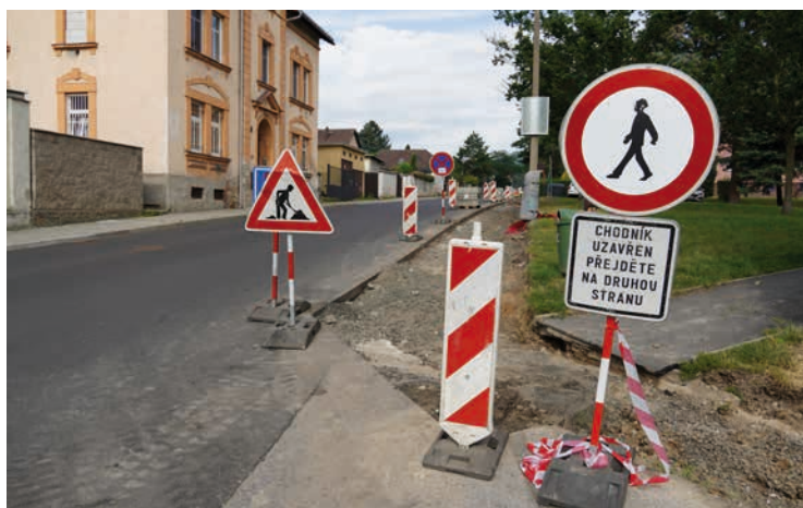
Krásnostudenecká – Krásnostudenecká, Žatecká, Lounská a Bílinská: v těchto ulicích se opravují chodníky. Součástí je také výměna silničních a zahradních obrub.