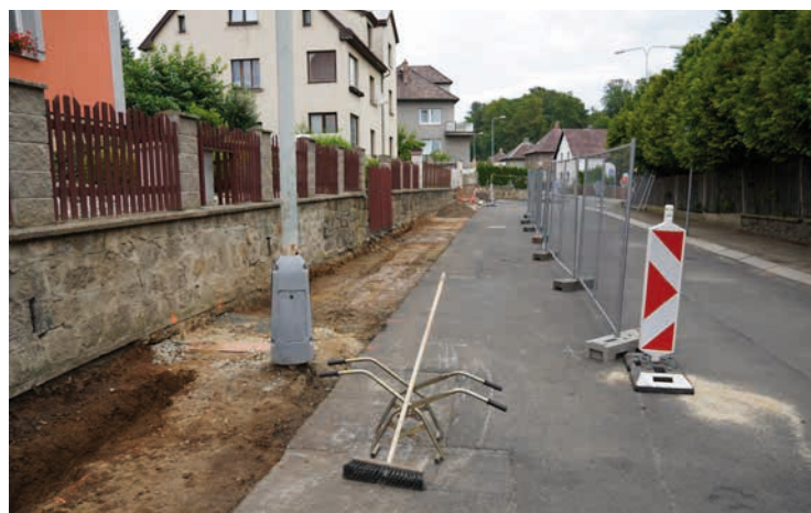
Škroupova – Ve Škroupově ulici během léta probíhá oprava chodníků, dále oprava kabelového vedení veřejného osvětlení včetně stožárů a svítidel. Nový povrch dostane také komunikace.