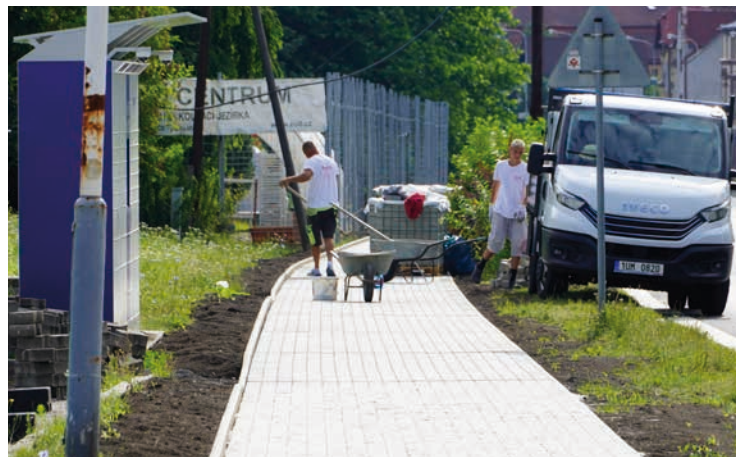
Bynov – Na Teplické ulici v Bynově město rekonstruuje chodník mezi místními markety v délce 280 metrů. Chodníky budou mít také nové obrubníky.