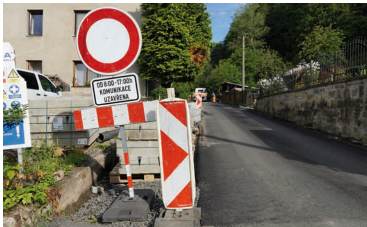
Bělá – V Bělé probíhá oprava části Družstevní ulice, kterou poničily bleskové povodně. Kromě toho nechá město opravit ulici Na Nivách a místní mostek.