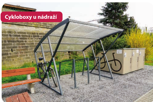
Cykloboxy u nádraží