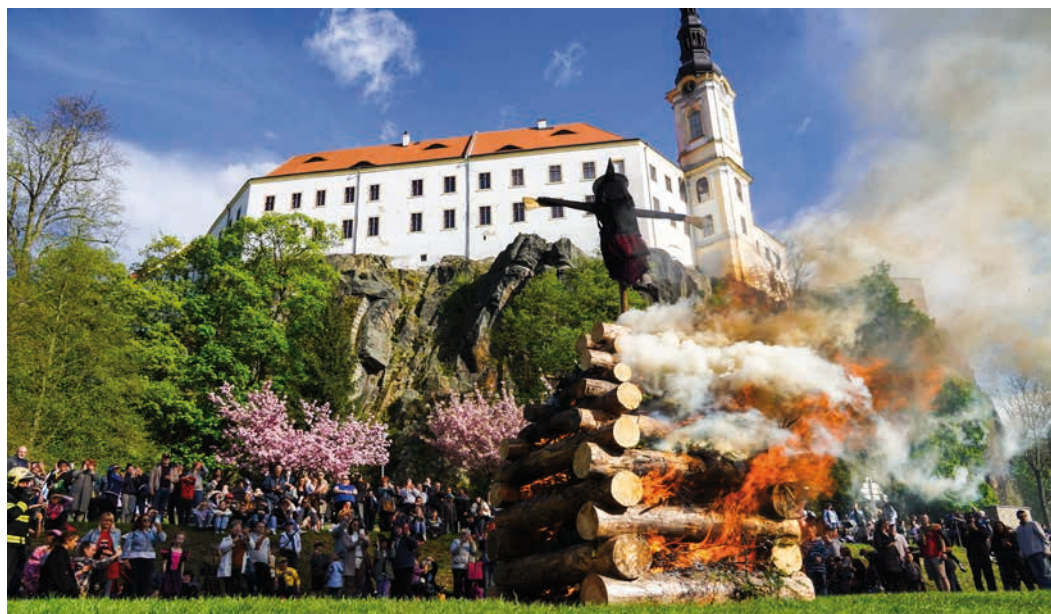
FOTO: Pálení čarodějnic na Smetanově nábřeží