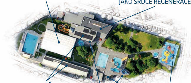
TECHNOLOGICKÁ STABILITA A VYŠŠÍ KOMFORT