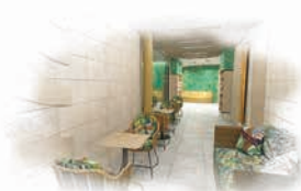
WELLNESS JAKO SRDCE REGENERACE