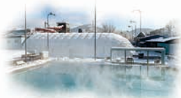
MODERNIZACE 50M BAZÉNU S CELOROČNÍM PROVOZEM